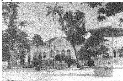
Academia Valenciana de Letras.

POPULAÇÃO — O Recenseamento Geral de 1950 registrou para o município a população de 36 126 habitantes, sendo 18 130 do sexo masculino e 17 996 do feminino. Dessa população, 19 796 fixavam-se no quadro rural, que tem ligeira ascendência sobre a população urbana municipal, apesar de a cidade registrar cerca de um terço da população de todo o município. A densidade demográfica é de 25,73 habitantes por quilômetro quadrado. — A população de Marquês de Valença distribui-se pelos distritos